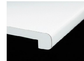
メラミンポストフォーム