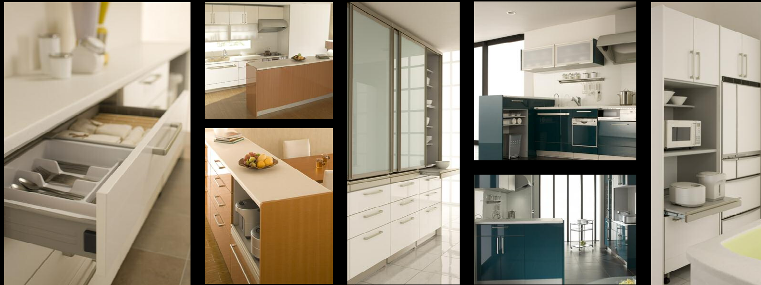
※写真は全てイメージ画像です。